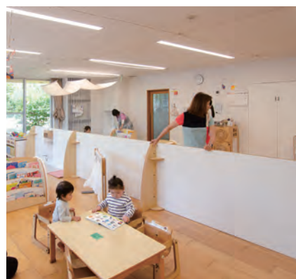
パネルの端にエリアパネルを設置しています