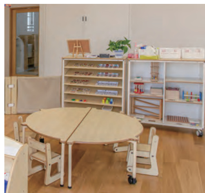
視野を狭め集中させます