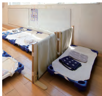
どこへでも動かせるパーティションです