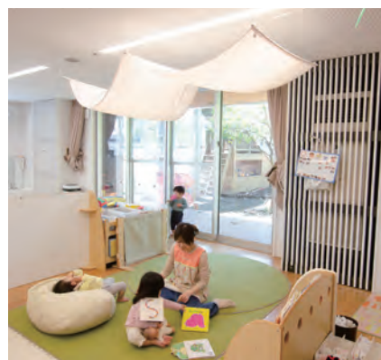
電気の直視をさけます