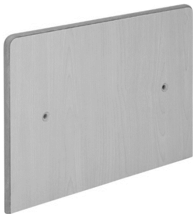
ブロックベンチ [エンドパネル] : 1枚

この度は当社製品をお買い求め頂き、誠にありがとうございます。本書は製品を正しくお使い頂くために必ずお読み下さい。今後ともご愛顧賜りますよう、何卒よろしくお願い申し上げます。