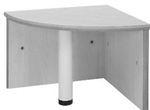
ブロックベンチ [コーナー] : 1台